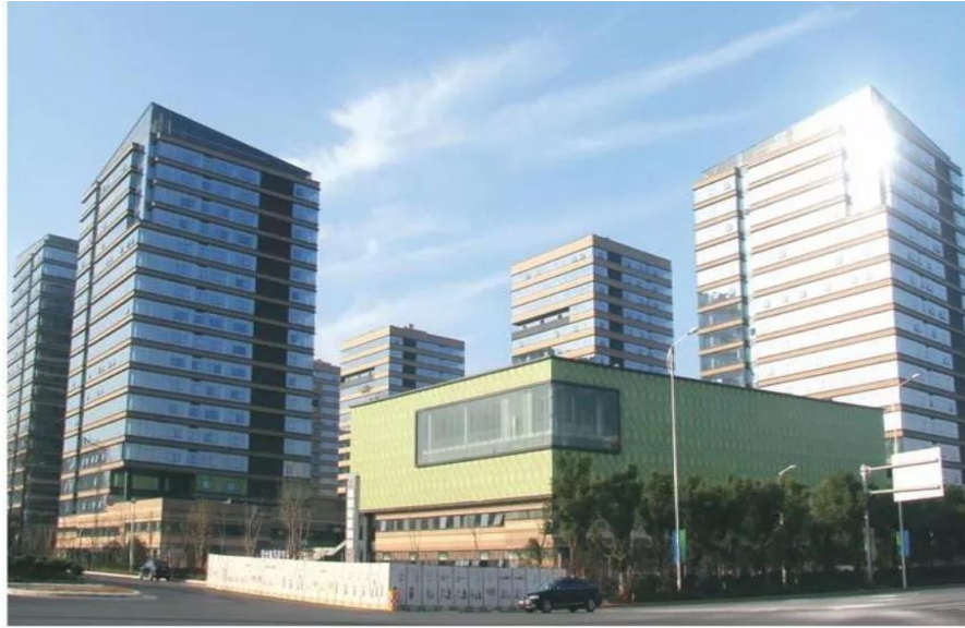
中国（南昌）虚拟现实产业基地

南昌市工信委相关负责人介绍，在2016年6月份，南昌市出台相关政策，加快VR/AR产业发展，政策中专门提到招引该领域的人才待遇。“凡来南昌市从事VR/AR产业的院士或相当于院士的领军人才，给予安家补助100万元；对国家级领军人才或相当水平的人才，给予安家补助50万元；对省级领军人才或相当水平的人才，给予安家补助30万元。安家补助由南昌市和受益财政按1:1分担，分三年拨付到用人单位。”该负责人介绍，南昌市对VR/AR产业新引进的高层次优秀人才，按相应标准及其实际工作时间，每月发放1000-5000元不等的工作补贴，提供人才公寓或按月500-2000元提供租房补贴，期限不超过三年。